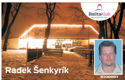
VZOR ČÍSLO 4