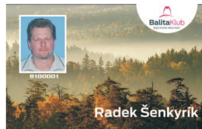
VZOR ČÍSLO 8