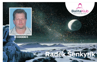
VZOR ČÍSLO 7