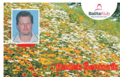
VZOR ČÍSLO 9