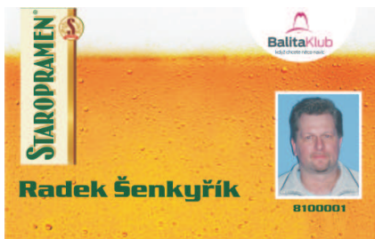
VZOR ČÍSLO 1