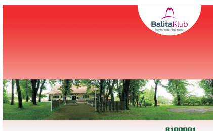
VZOR ČÍSLO 3