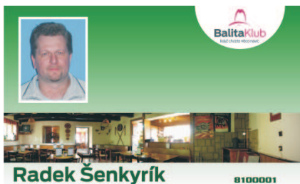
VZOR ČÍSLO 2