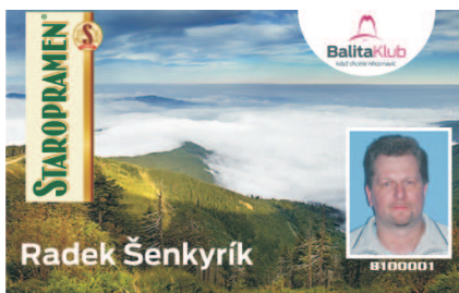
VZOR ČÍSLO 5